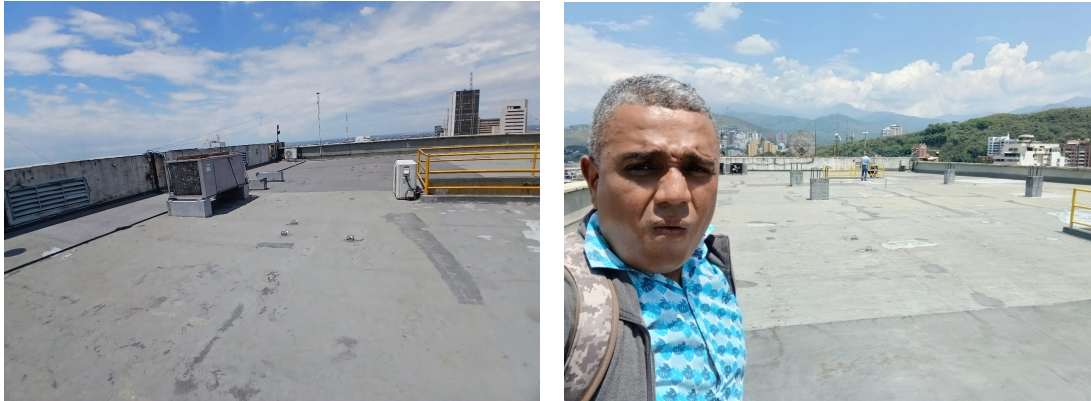
Figura No2

Realice visita técnica de verificación a la cubierta del CAM piso 16, con el fin de verificar las filtraciones de aguas lluvias y humedades que se presentan en cielos y muros del piso 16 UAEGBS CAM.