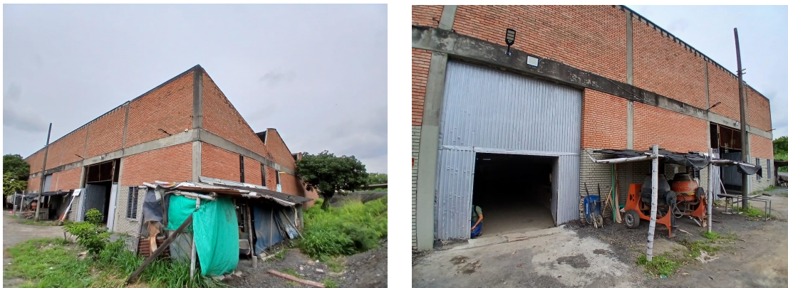
Figura No3

Realice visita técnica de verificación a la infraestructura física de las instalaciones de los TALLERES DEL EL MUNICIPIO, Bodega Adoquines, ubicada en el barrio Siete de entre la autopista Oriental y la carrera 8 de Santiago de Cali.