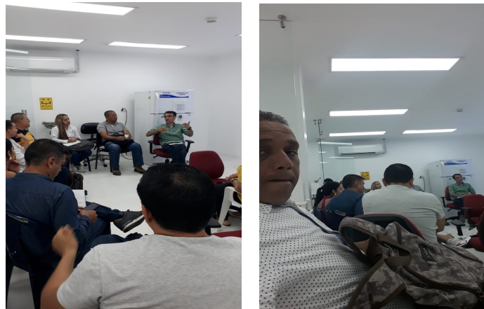
Figura No1.

Asistí a la socialización de los requerimientos técnicos para cumplimiento de las plazas de mercado de la ciudad de Cali, en Secretaria Distrital de Salud – sala de riesgos de análisis en salud Calle 4B # 36-00 Barrio San Fernando.