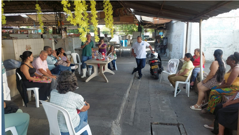
Figura No4

Asistí a la reunión de socialización de las obras proyectadas como mejoramiento para la infraestructura de la plaza de mercado de Alfonso López, administrada por la unidad administrativa especial de gestión de bienes y servicios de Santiago de Cali.